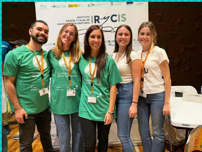
“Descifrando la microbiota: las bacterias que nos acompañan”