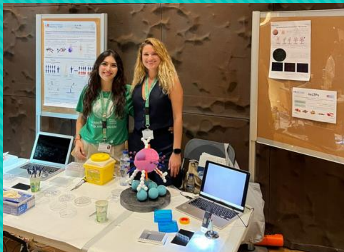
“Detección in situ de alérgenos mediante el kit LateralFLO Array”