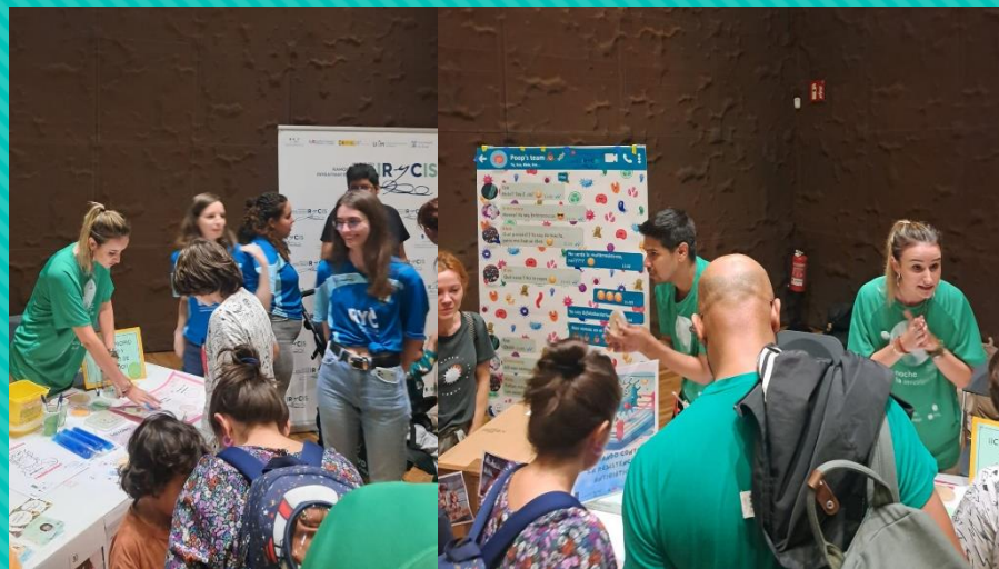
“Luchando contra la resistencia a antibióticos”