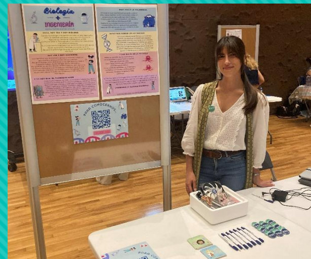
“Ingeniería y Biología: una alianza perfecta”