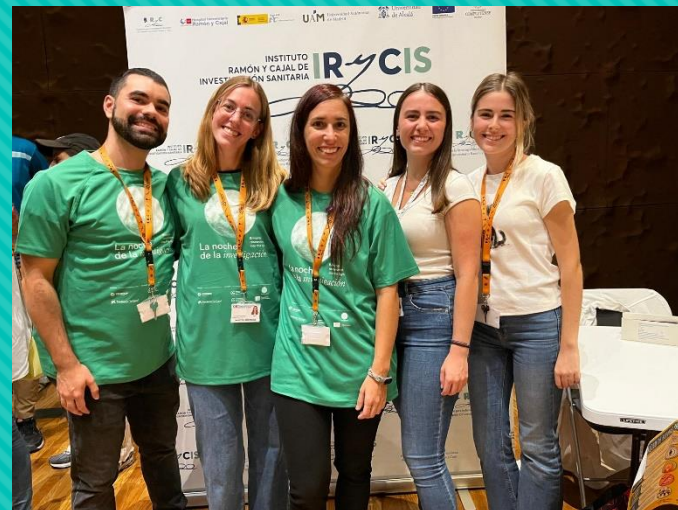
“El Maravilloso Viaje de los Microbios: Amigos Invisibles que Cuidan de Ti”