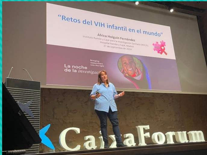
África Holguín: “Retos del VIH infantil en el mundo”